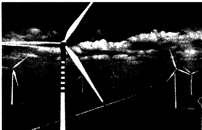
ERG Renew opera nel settore dell'energia prodotta da fonti rinnovabili

È il gruppo storico che ha legato il proprio marchio allo sviluppo industriale del nostro Paese